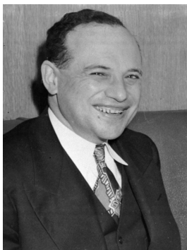
เบนจามิน เกรแฮม (Benjamin Graham)

รายงานฉบับนี้จัดทำขึ้นโดยข้อมูลเท่าที่ปรากฏและเชื่อว่าเป็นที่น่าเชื่อถือได้แต่ไม่เป็นภาระยืนยันความถูกต้องและความสมบูรณ์ของข้อมูลใดๆ โดยบริษัทหลักทรัพย์ ยูเอสบี เคย์ เฮียม (ประเทศไทย) จำกัด (มหาชน) ผู้จัดทำขอสงวนสิทธิ์ในการเปลี่ยนแปลงความเห็นหรือประมาณการต่าง ๆ ที่ปรากฏในรายงานฉบับนี้ โดยไม่ต้องแจ้งล่วงหน้า รายงานฉบับนี้มีวัตถุประสงค์เพื่อใช้ประกอบการตัดสินใจของนักลงทุน โดยไม่ได้เป็นการชี้นำ ชักชวนให้นักลงทุนทำการซื้อขายหลักทรัพย์ หรือตราสารทางการเงินใดๆ ที่ปรากฏในรายงาน